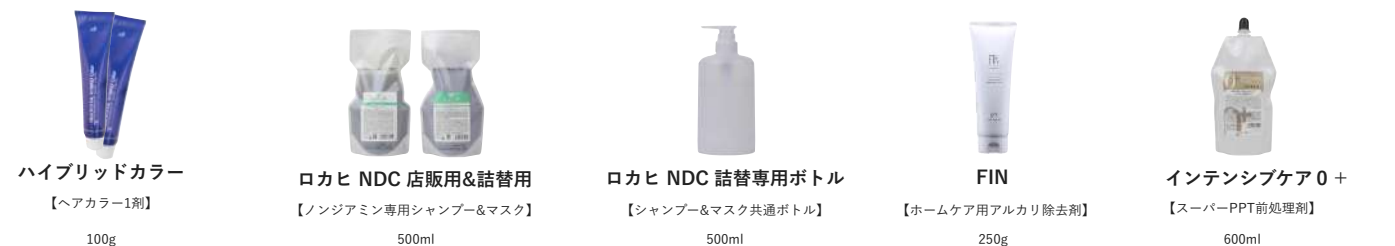
ハイブリッドカラー 【ヘアカラー1剤】 100g

アペティート 化粧品 A P E T I T E C O S M E T I C S P