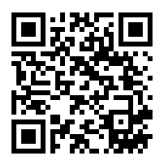
Web版カラーチャート

ノンジアミンカラーのクリアな発色を一度ご覧ください。 またHPにてWeb版ヘアカラーチャート・施術動画・レシピ情報なども掲載しております。