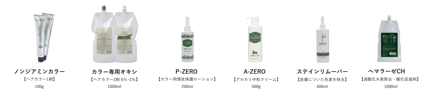
ノンジアミンカラー 【ヘアカラー1剤】 100g カラー専用オキシ 【ヘアカラー2剤 6%・3%】 1000ml P-ZERO 【カラー用頭皮保護ローション】 200ml A-ZERO 【アルカリ中和クリーム】 500g スティンリムーバー 【皮膚についた色素を除去】 400ml ヘマラーゼCH 【過酸化水素除去・酸化促進剤】 1000ml